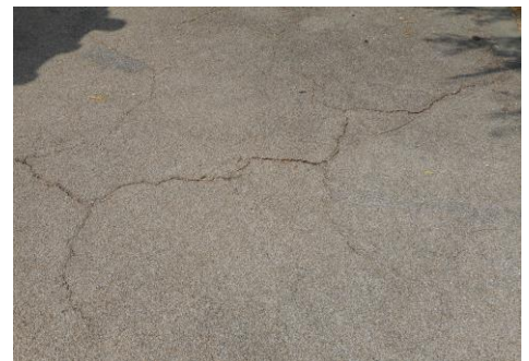
亀裂の入った山与遊歩道路面

工事期間は8月下旬～9月下旬が予定されており、その期間、遊歩道は全面通行止めになります。