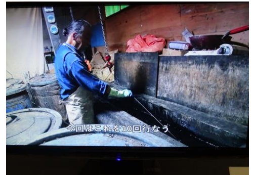
嵐絞りの藍染め風景（蔵工房にて）