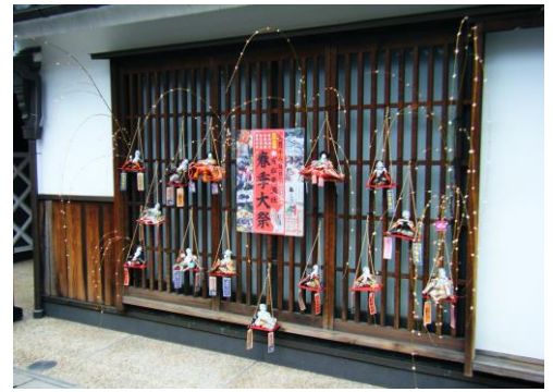
中町年行司の「まつり」 花もちと雛の頭にまめ紋り

詳細については、同封のチラシ「春のありまつさんぽ道」をご覧ください。開催時期：3月5日～3月25日