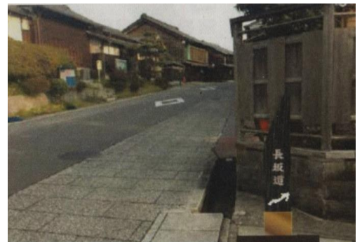
小路名称看板設置想定写真 (長坂道の側面)

なお設置されるのは、長坂道、切り通し、天王坂、山与遊歩道、分かれ道の5ヶ所の予定です。