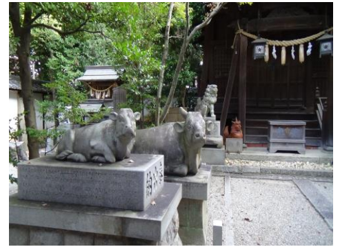
有松天満社の御神牛