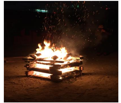
燃え上がる炎を囲みながら 有松の火伏を願う