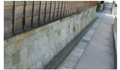
亀甲積（中濱家北側）