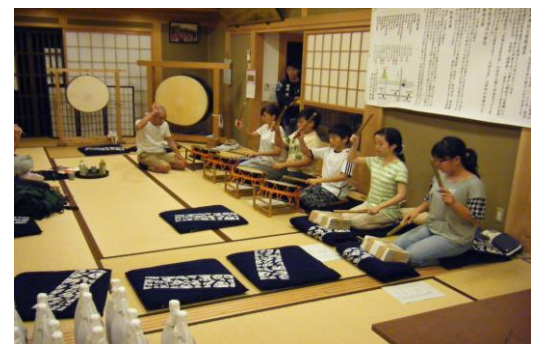
新人のお囃子稽古風景

楫方に2名と今年から囃し方に参加の3名です。囃し方としての初出演は、前夜祭の囃子込みを予定しています。