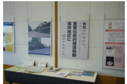
まちづくり広場での展示風景