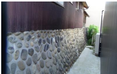
玉石積（川村家北側）