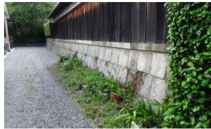
間知積（布積、服部良也家東側）